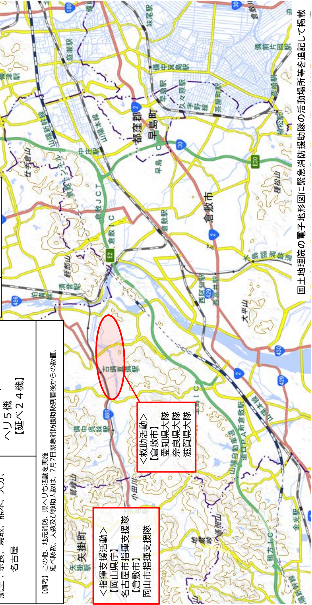
国土地理院の電子地形図に緊急消防援助隊の活動場所等を追記して掲載