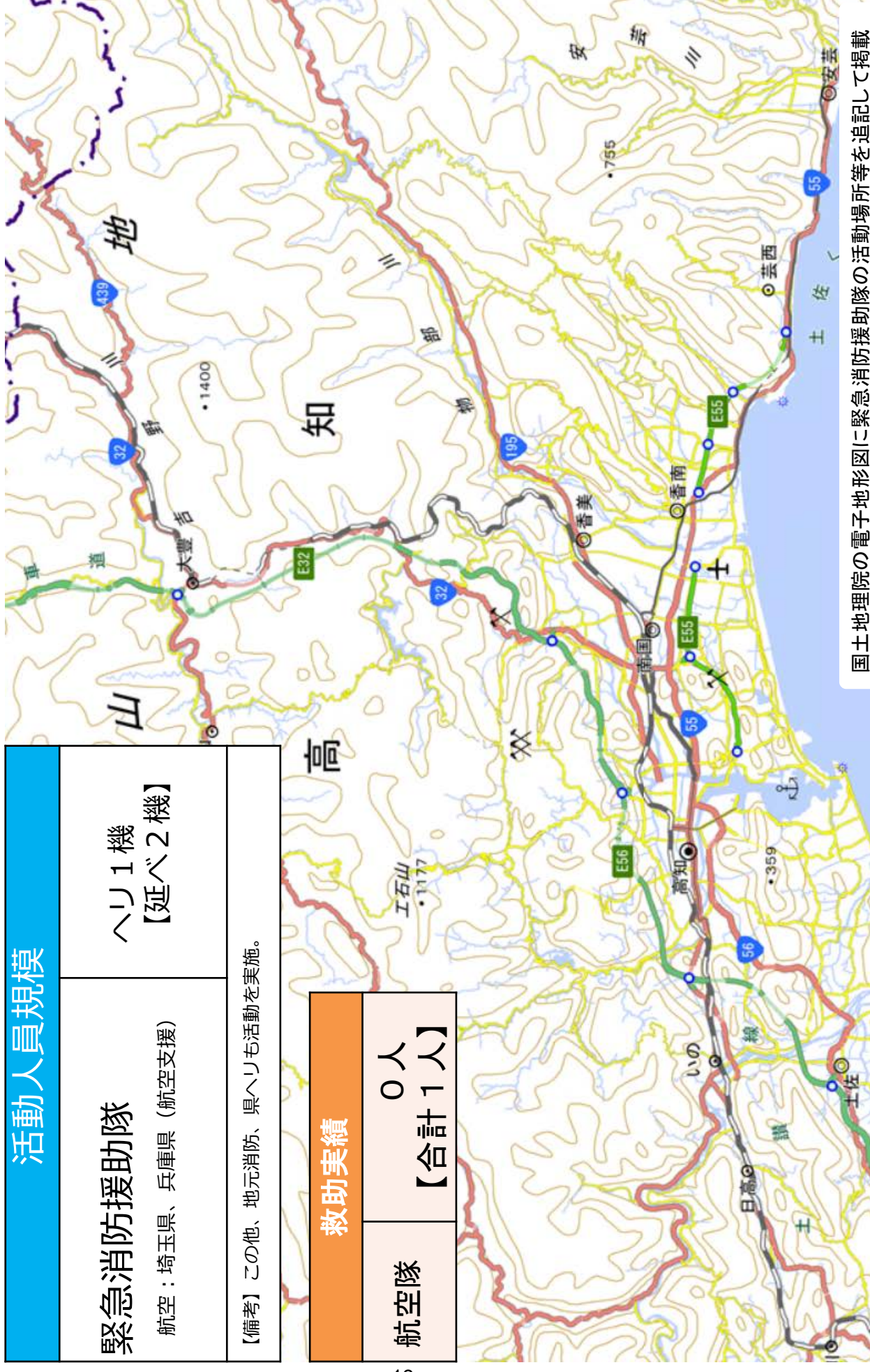
国土地理院の電子地形図に緊急消防援助隊の活動場所等を追記して掲載